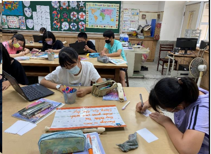
說明6：製作Mother's Day Coupons