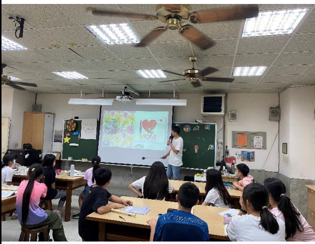
說明1：進行繪本導讀