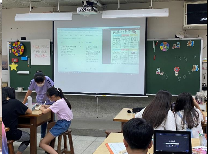
說明2：分組閱讀繪本，寫下單字與片語