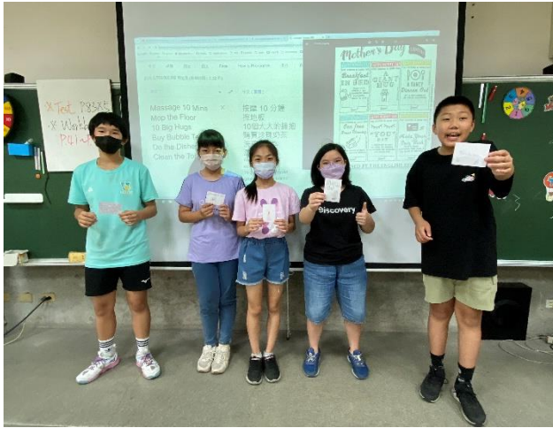
說明 7：Mother's Day Coupons發表會