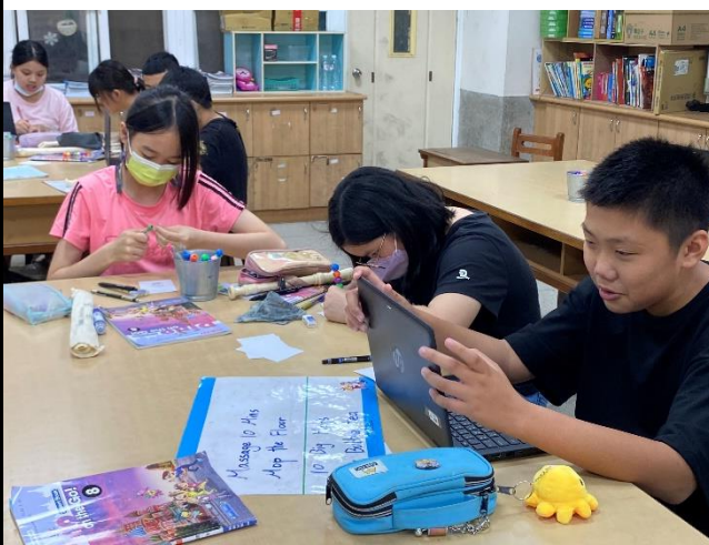
說明5：製作Mother's Day Coupons