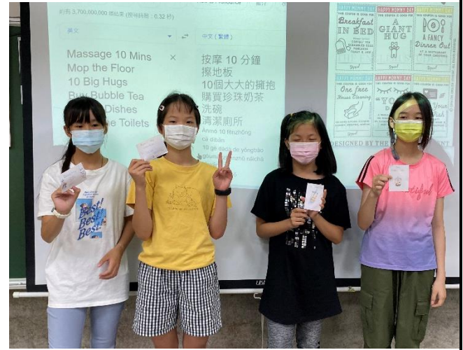
說明8：Mother's Day Coupons發表會