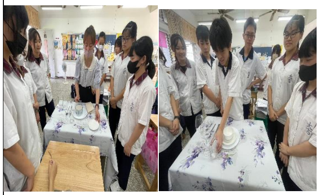
說明4：餐桌擺設教學及實做課程，讓學生了解餐桌擺設也是用餐禮儀的一個重要環節。