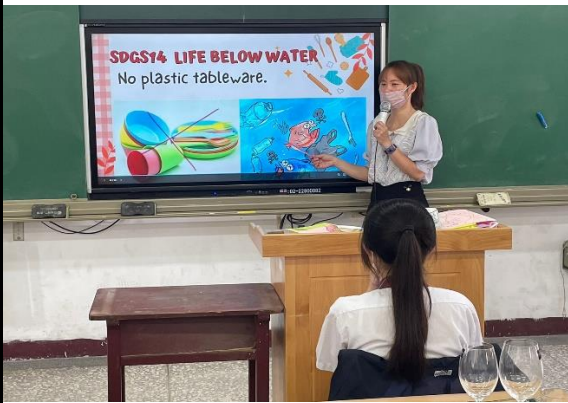
說明3：課程融合聯合國SDGs14保育海洋之永續發展目標，讓學生培養更多國際素養。