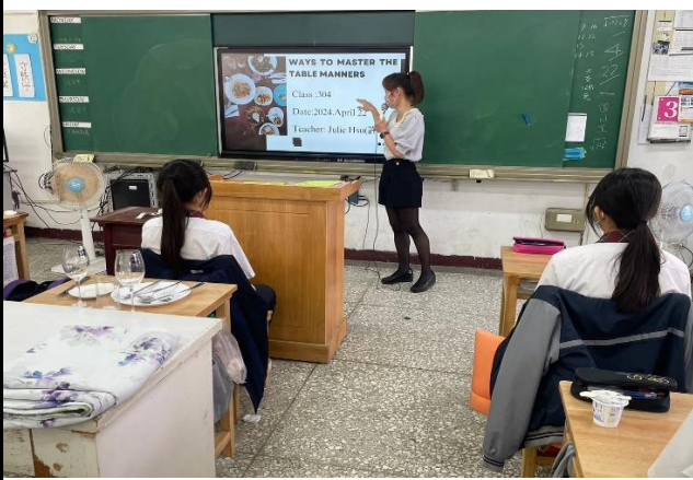
說明1：教師利用Canva自製課堂簡報，主題為” Ways to Master Table Manners”