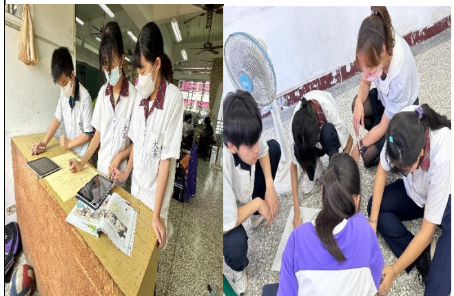
說明6：教師利用繪本進行” Table Manners” 主題教學各組利用ipad收集相關用餐禮儀知識，進行教學後的討論及分享。