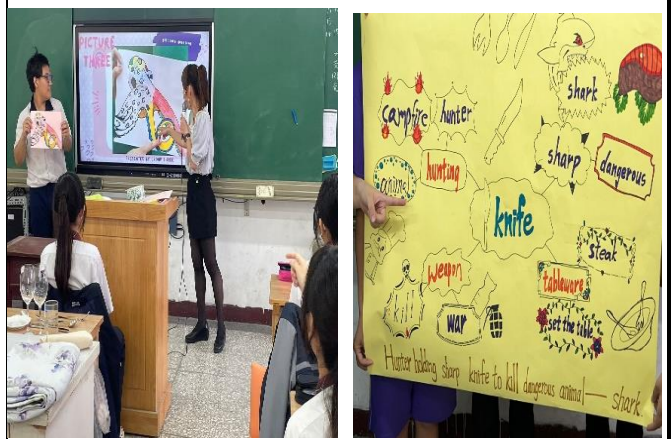
說明2：利用word guessing和mind map活動，提昇學生學習興趣並達到差異化教學目標。