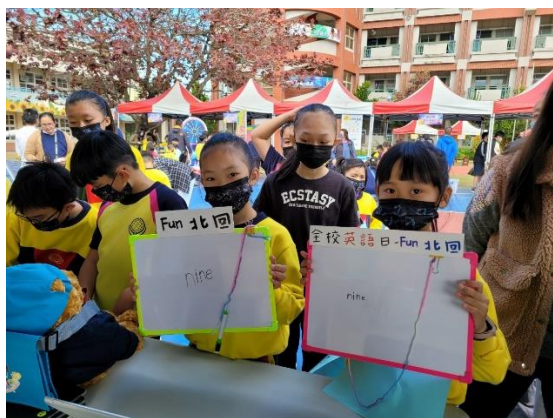
中高年段學生任務三： 利用 5 個問題推論出單字並寫在白板