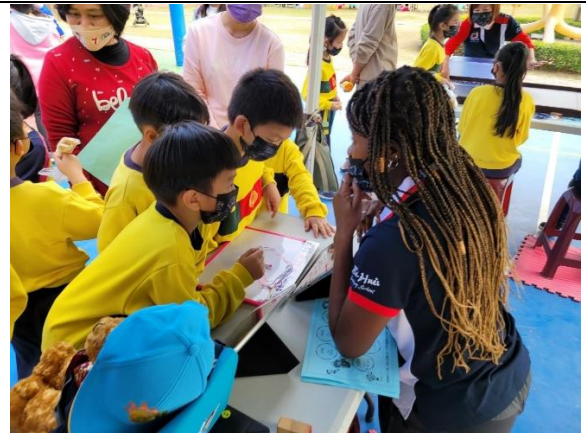
中高年段學生任務二： 學生用英語問關主 5 個問題，關主只能 YES/NO 回答