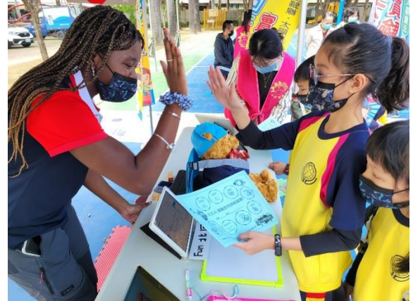
任務達成 可以關主 high five 過關