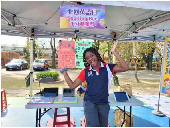
外師第一次參加台灣校慶活動並擔任關主