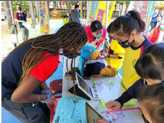
中高年段學生任務二： 學生用英語問關主 5 個問題，關主只能 YES/NO 回答