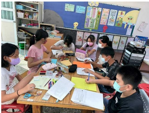
生肖年節卡片製作與寫作