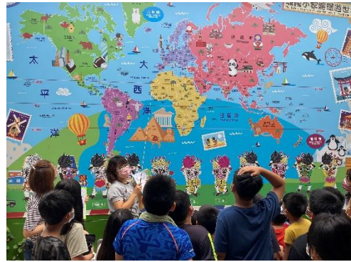
說明要寄送卡片的國家位置