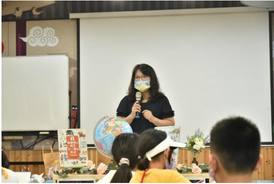
校長說明卡片傳真情的意義