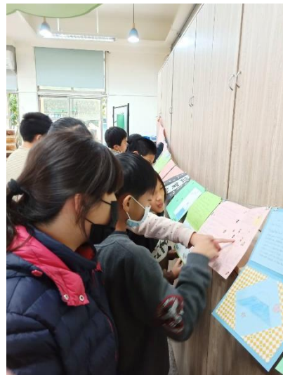
分享來自日本的卡片