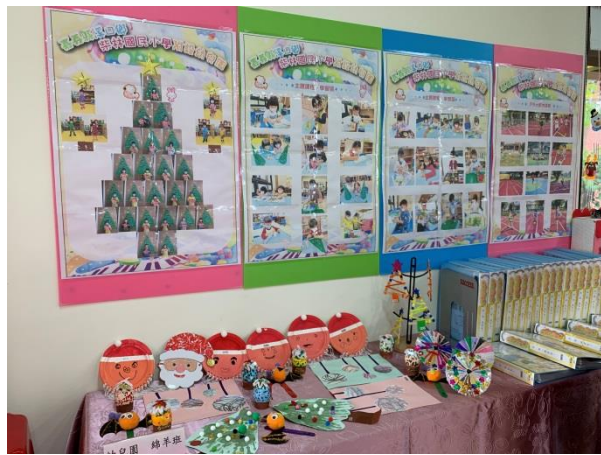
幼兒園英語日成果布置