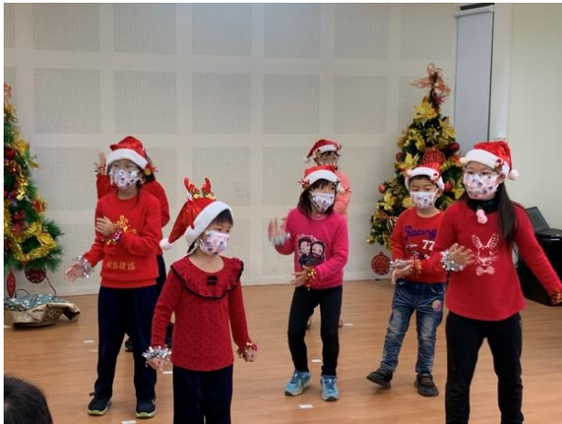
低年級英語律動表演