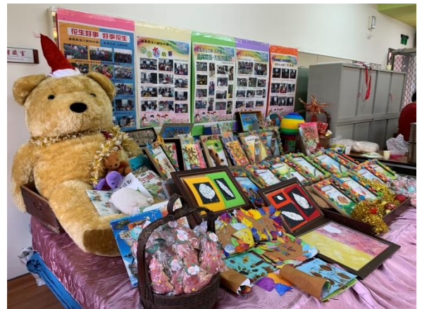
班級英語日成果布置