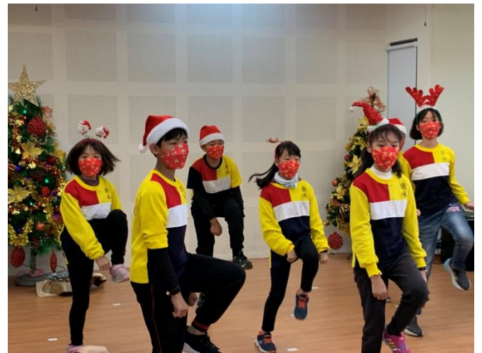
高年級英語律動表演