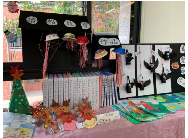
班級英語日成果布置