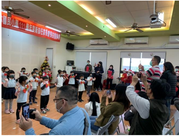
家長熱情參與英語日活動