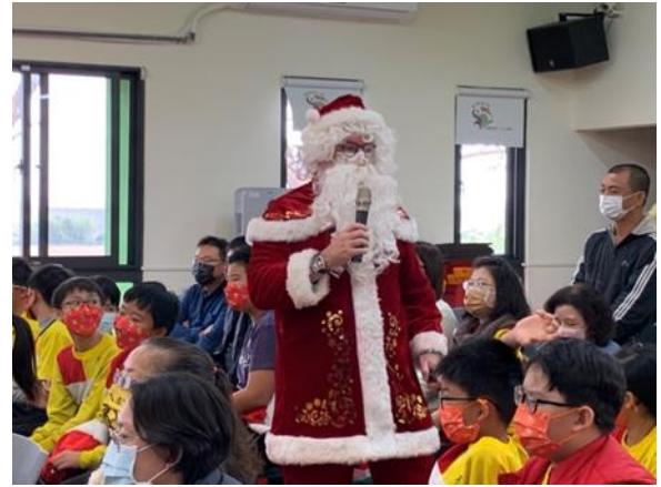
寫給聖誕老公公的一封信與講故事活動