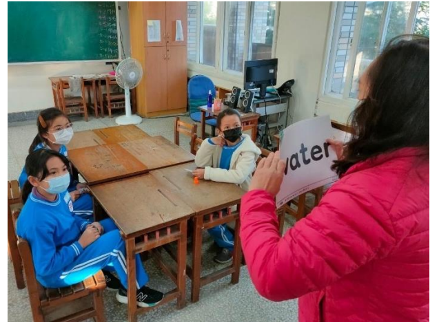
學生能大聲念出指定單字。