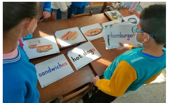
學生正確將圖卡字卡配對。