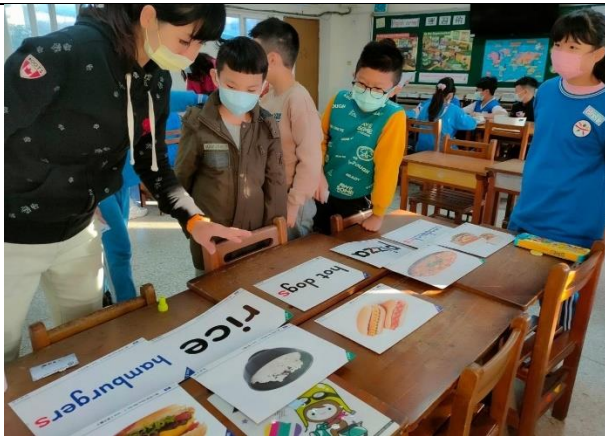
學生正確將圖卡字卡配對。