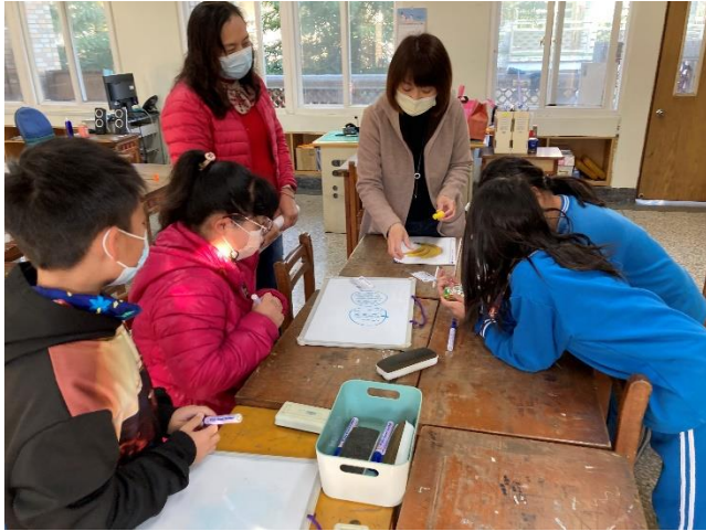
學生依指令在白板畫出指定食物。