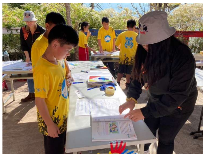
Play Mad libs