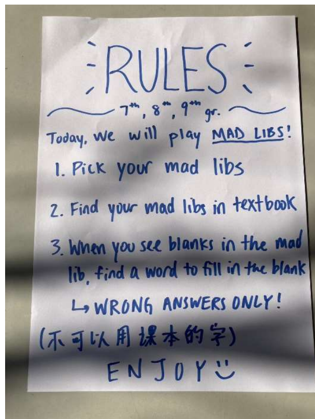
七~九年級遊戲規則說明