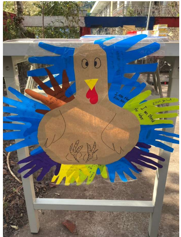
學生感恩節創作作品展示