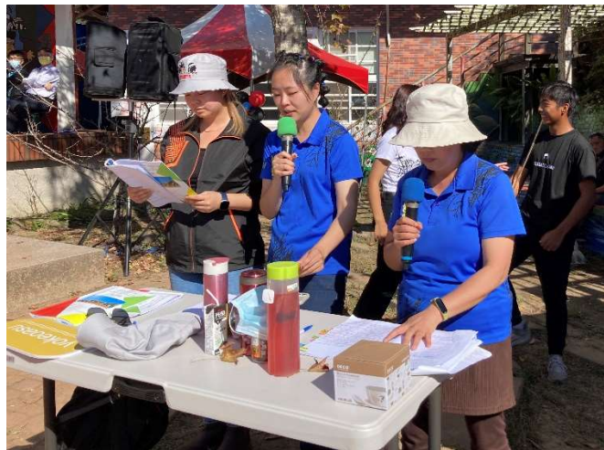
英語、中文、鄒語共同主持