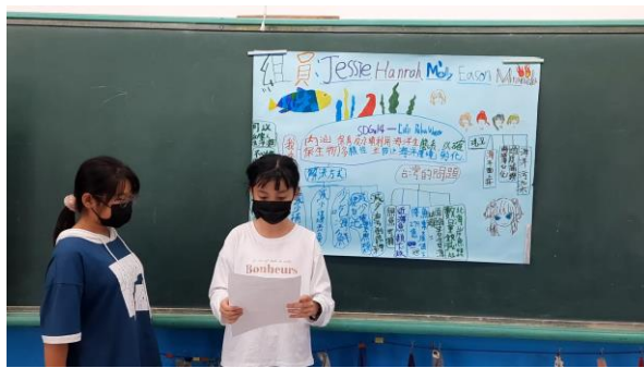
五年級：SDGs 英文學習簡報 (表格不夠，請自行增列)