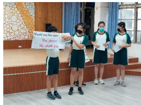
六年級：進行英語學習成果展演