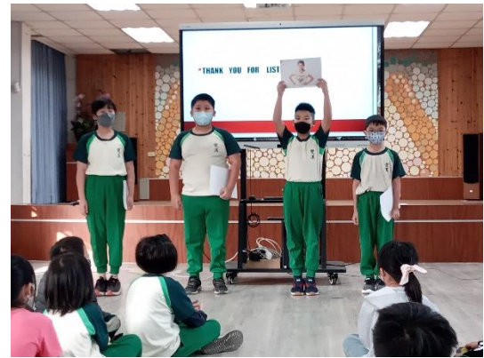
四年級：進行英語學習成果展演