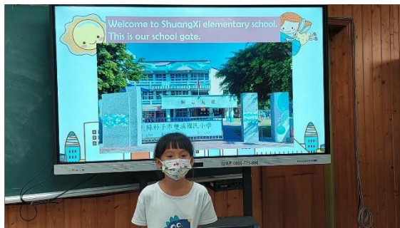
三年級：使用簡單的英語介紹學校