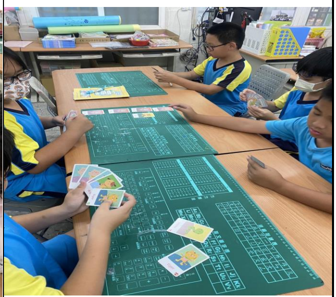
說明 6：進行 12 生肖卡牌接龍遊戲，加深學生對 12 生肖單字聽讀說的能力。