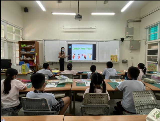
說明 1：向學生提問引導進入今日主題 Lunar New Year。