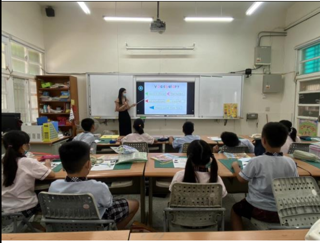
說明 3：總複習今日學習到的單字。