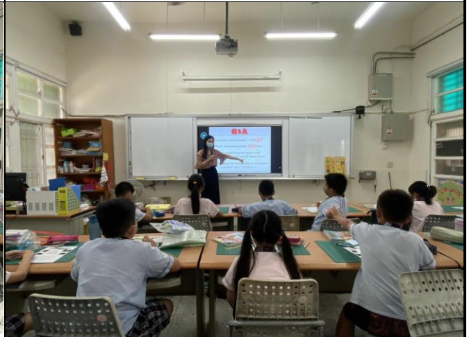
說明 4：針對學習單進行檢討。