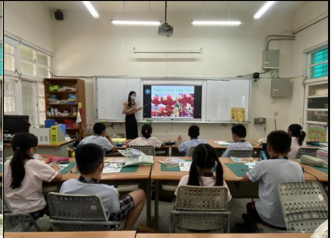
說明 2：Lunar New Year 單字教學。