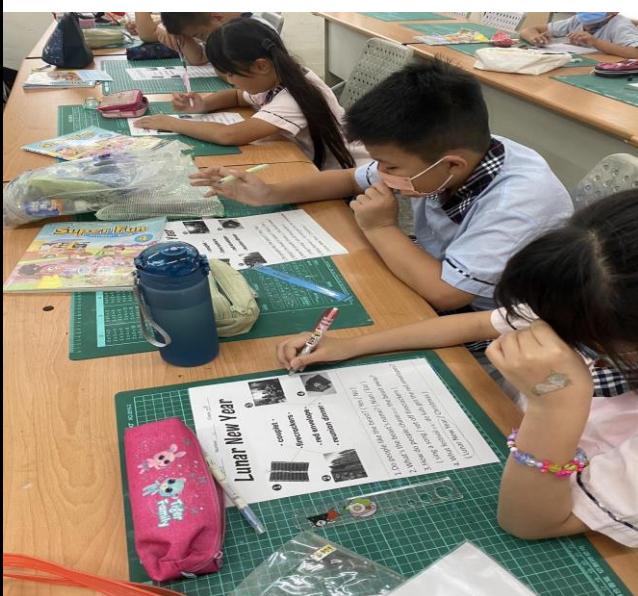
說明 5：學生們於課堂上進行學習單後測。