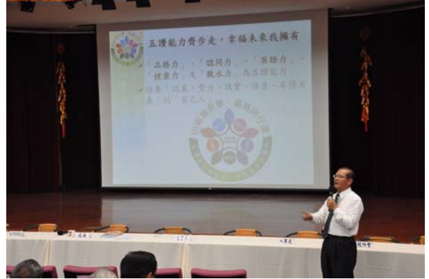
· 王處長說明英語能力的重要性