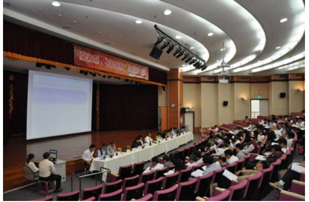
· 校長會議現場實況