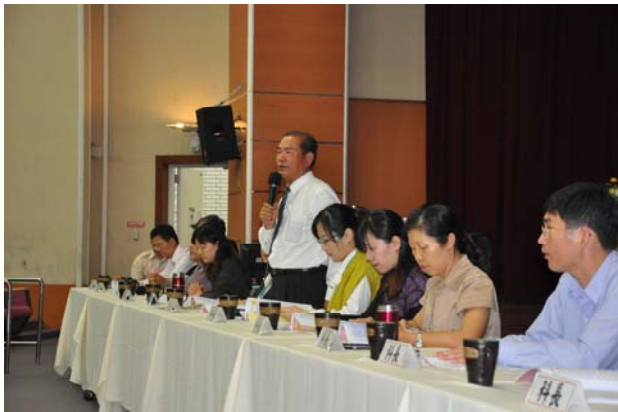
· 王處長說明嘉教五讚英語力實施重點