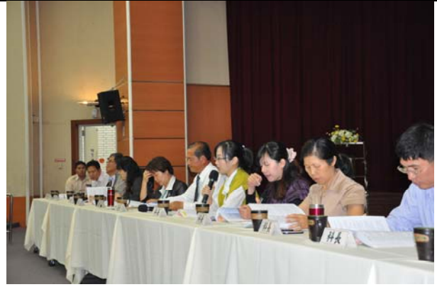
· 學管邱科長說明102年度英資中心重點業務