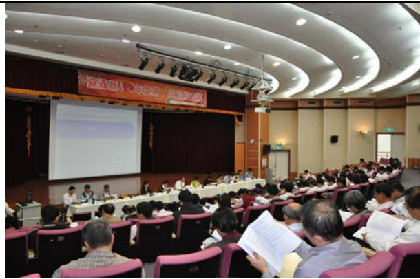
· 參加會議的各校校長