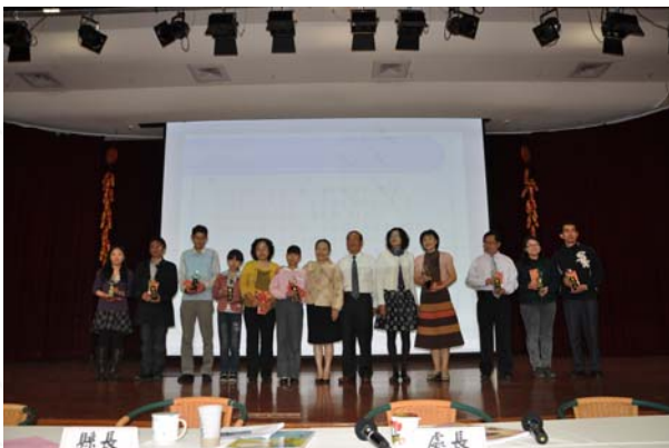
· 頒發嘉義縣優良英語教學學校獎