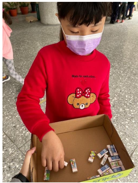
完成闖關可兌換小禮物。