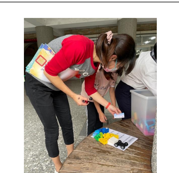
學生依照指令卡要求的數量及顏色找出所需積木。