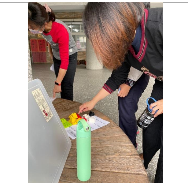
學生依照指令卡要求的數量及顏色找出所需積木。