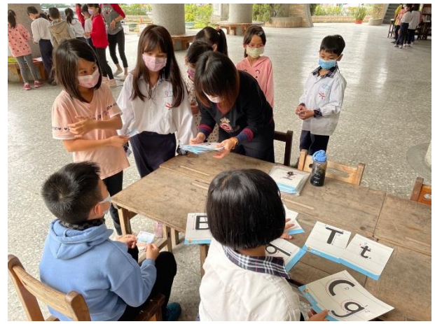
學生找出配對的大小寫字母卡。