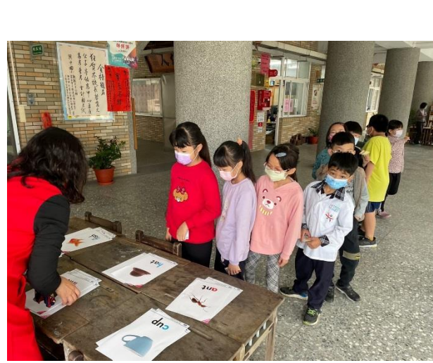
學生念出字母對應單字。