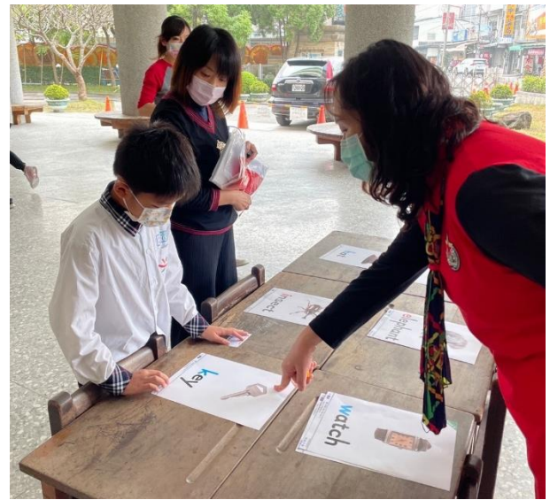
學生念出字母對應單字。