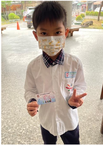
學生完成三個關卡。