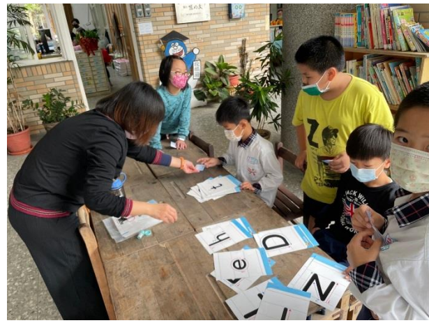
學生找出配對的大小寫字母卡。