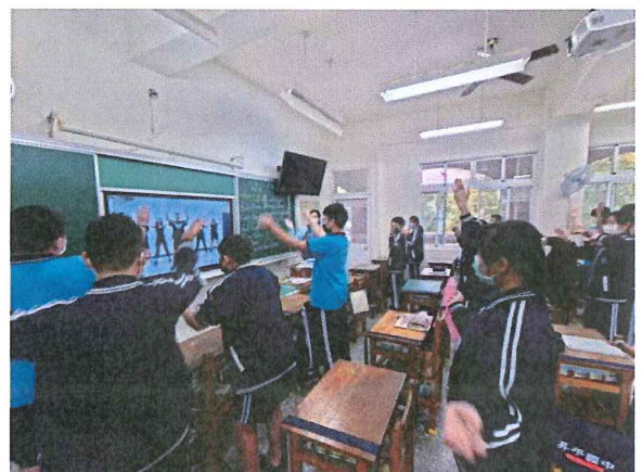
班級練習英文唱跳歌曲