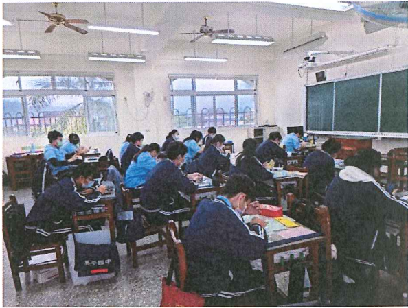
二忠英語單字比賽