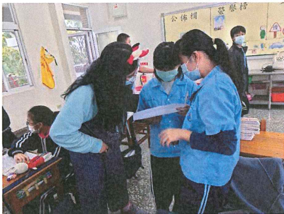
練習英文歌曲時向老師請教