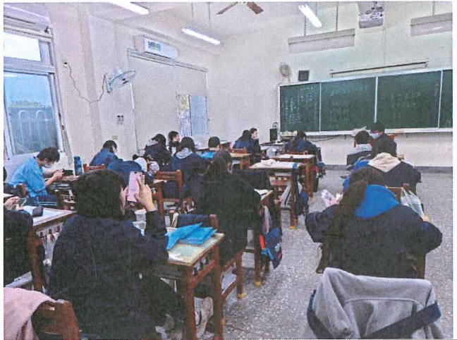
三忠英語單字比賽