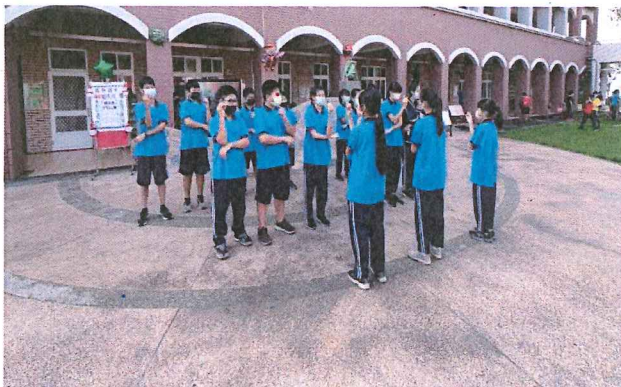
班級表演英文手指舞