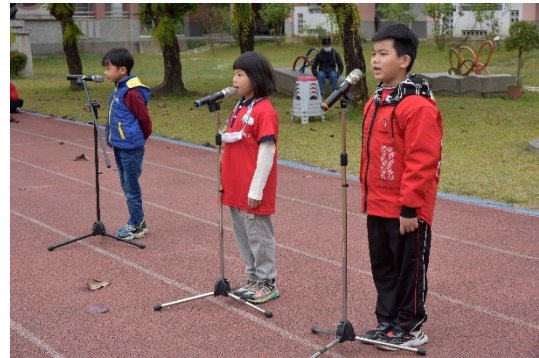
三位一年級小朋友演唱: Merry christmas & happy new year