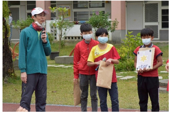
比手畫腳說英文 What' s this? That is a star.