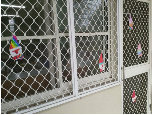
教室應節佈置搭配英語單字，營造歡樂氣氛