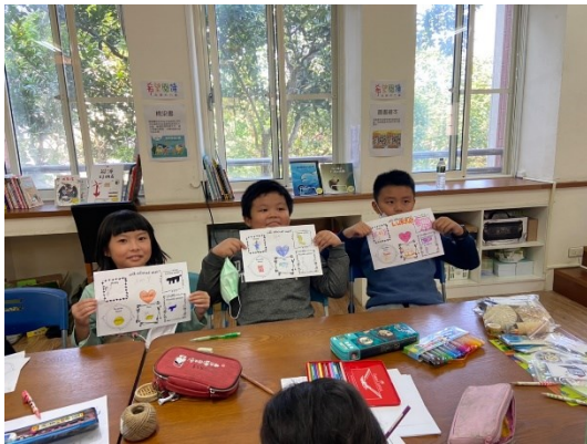
成功大學 BOOK 移市帶來有趣活動，讓學生英語發表不害羞