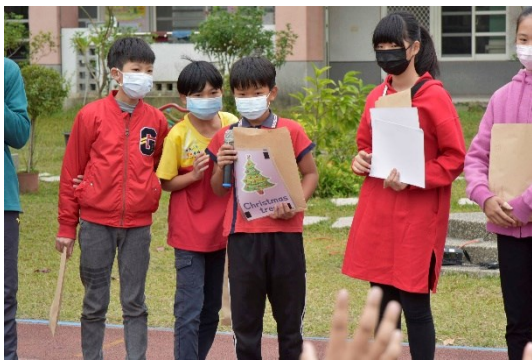
比手畫腳說英文 It' s green. It' s a plant. You will put star、lights and candy canes on it. → Christmas tree