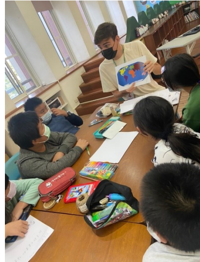
成功大學 BOOK 移市到大崙，三位外籍博士生帶學生口說英語談生活文化