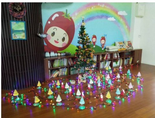
圖書館耶誕節裝置聖誕老公公/雪人/各式禮物