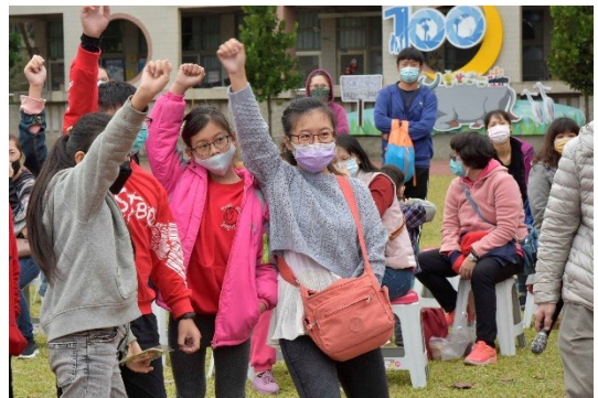
比手畫腳說英文 學生家長踴躍搶答