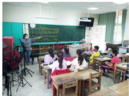
Jingle Bells 教唱