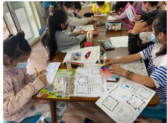
成功大學 BOOK 移市帶來有趣學習活動，生活化的學習單加上英語引導，英語好有趣