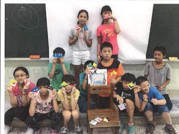
動手做中學習英語