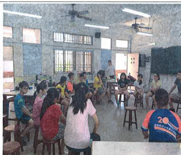
照片說明：惠婷老師活潑教學