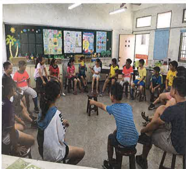
照片說明：英語破冰遊戲