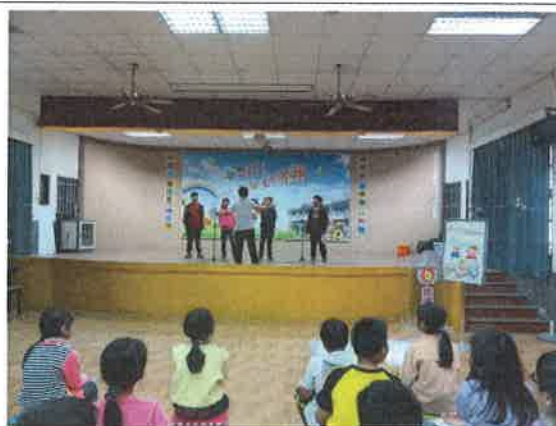
英語成果發表-RT 表演