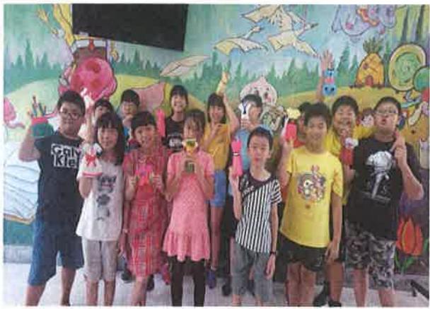
照片說明：親手製作各國特色服裝，並介紹分享。