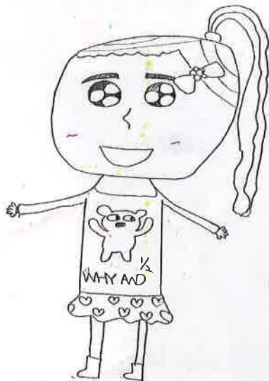
照片說明：學生作品