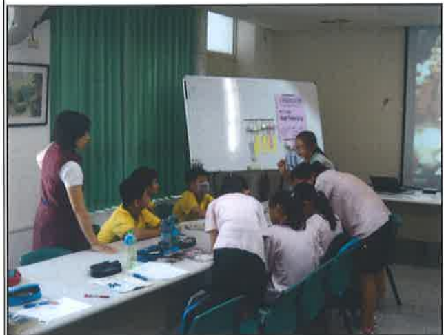
Writing:Reader Theater Script