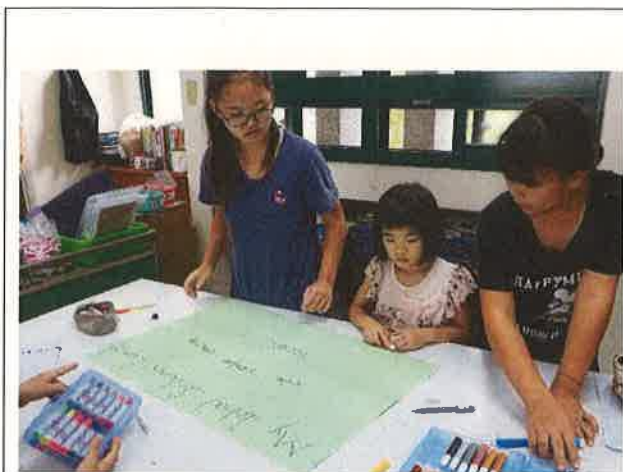
假日英語營學生認真寫作情形(一)