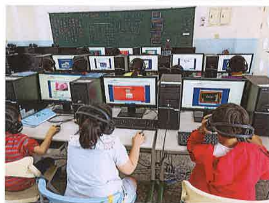
照片說明：資訊平台輔助教學