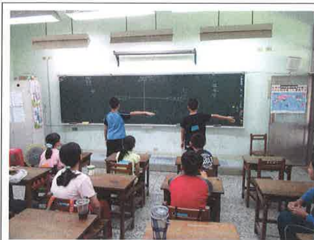
在實際方位活動中認識英語