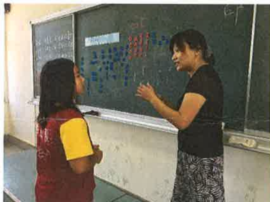
照片說明：老師指導學生自然發音。