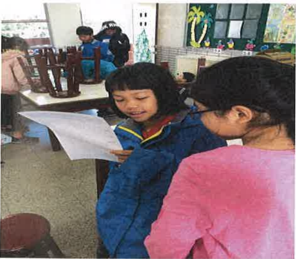
照片說明：學生練習口說能力及歌曲