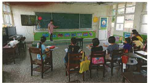
照片說明：自然發音教學，學生練習拼音。