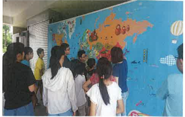
照片說明：利用學校世界地圖，介紹課程中國家的地理位置。