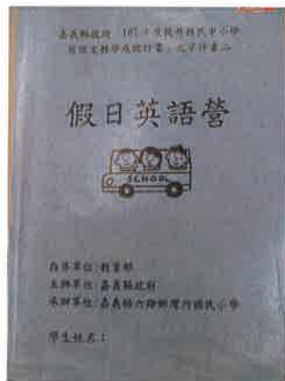
照片說明：自編學習教材