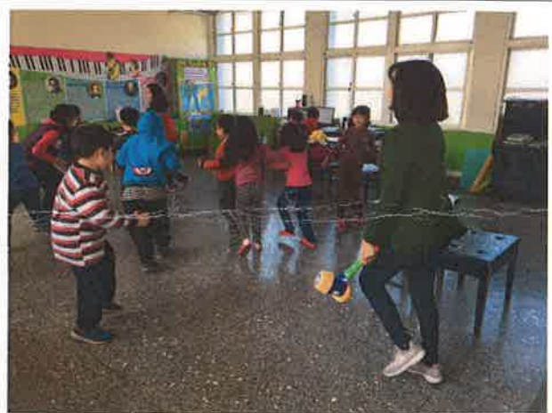
照片說明：自然發音活動式教學，學生聽音練習。