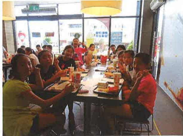
一起同樂享受美食