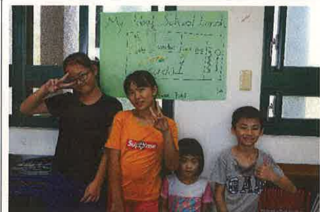
假日英語營學生成果作品(三)