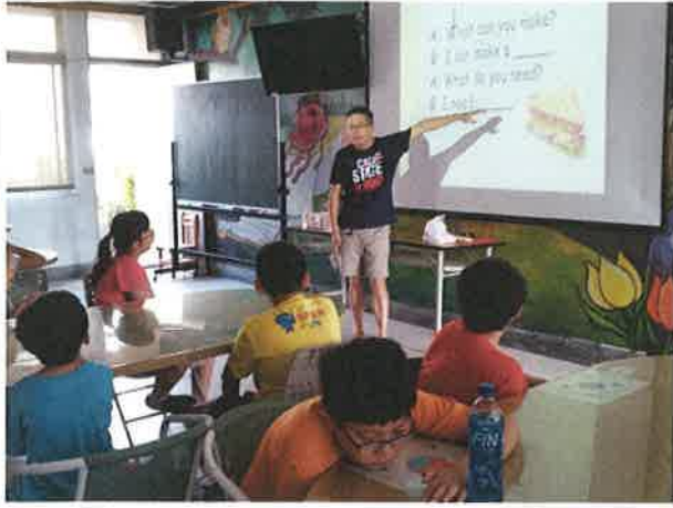
照片說明：英語課程句型介紹。