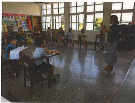
照片說明：自然發音教學，拼音練習。