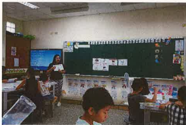
假日英語營學生仔細聆聽上課情形(三)