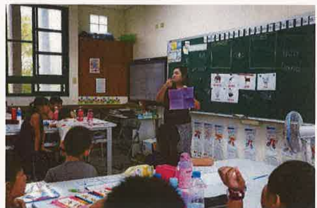
假日英語營學生仔細聆聽上課情形(四)