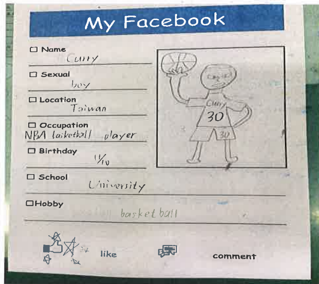
照片說明：學生作品