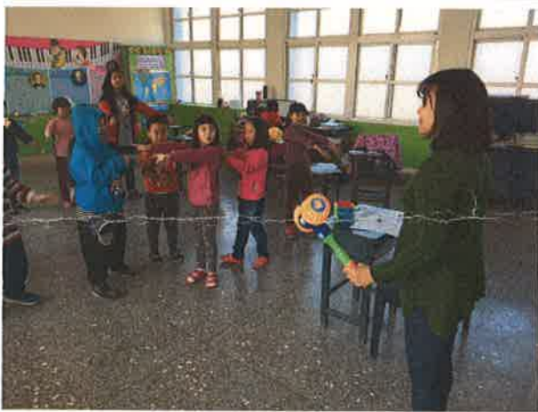
照片說明：老師指導學生自然發音。