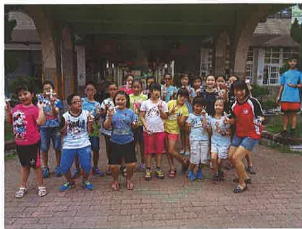
暑期英語營隊大合照