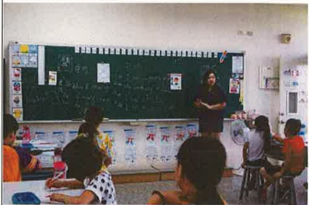
假日英語營學生仔細聆聽上課情形(二)