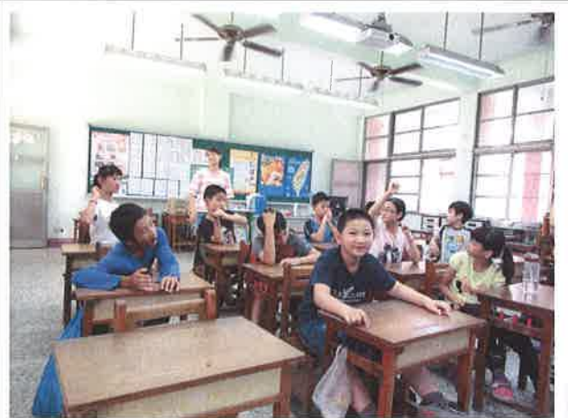
學生熱烈參與英語學習營