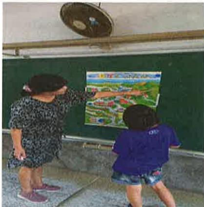
照片說明：老師指導學生自然發音。