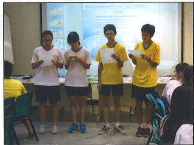
Read Aloud: Universal Love Blessing (祝福想祝福的人)