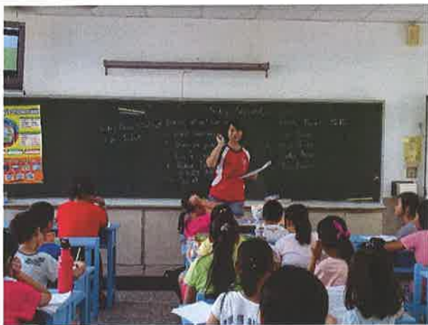
認識太陽能、風力等綠能