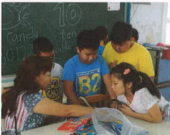
教師個別指導與說明