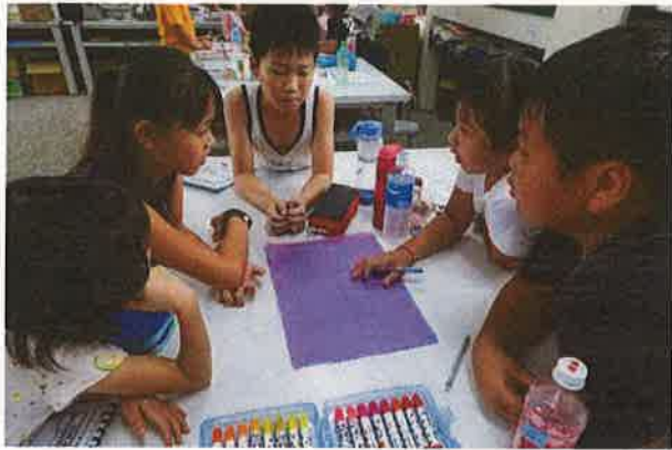
小組討論英語繪本如何呈現(一)