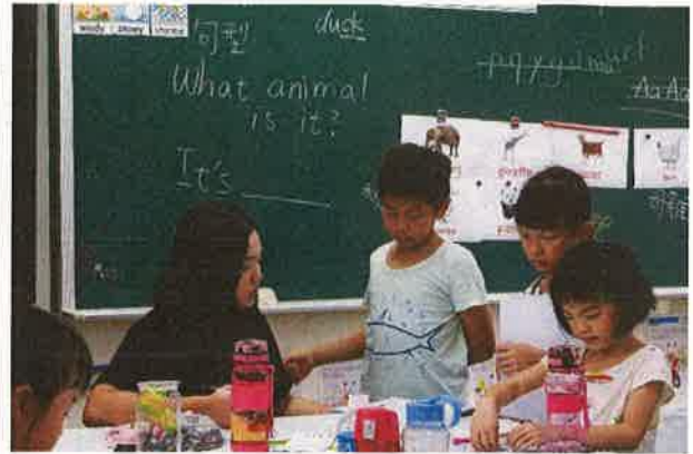
英語教師親自指導學生英語會話(二)