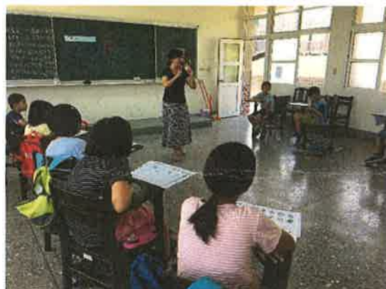
照片說明：自然發音教學，學生練習拼音。