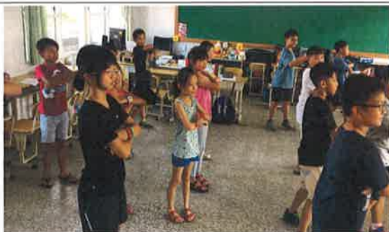
學生練習英語歌唱及舞蹈