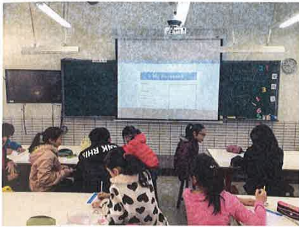
照片說明：臉書英語自我介紹