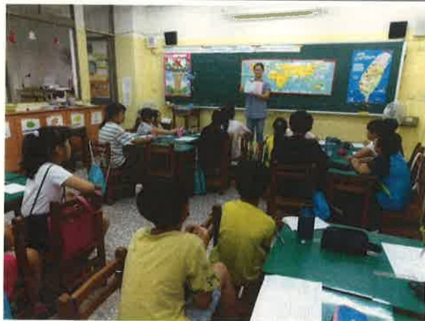
透過英語闖關、歌唱、戲劇、遊戲等，以引發學生英語的學習興趣與成效。