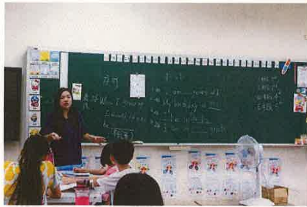
假日英語營上課情形(一)