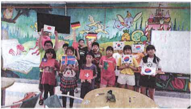
照片說明：彩繪課程中，介紹的國家地圖並介紹分享。