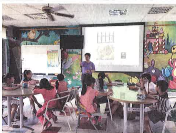
照片說明：開幕時，校長到現場勉勵大家。