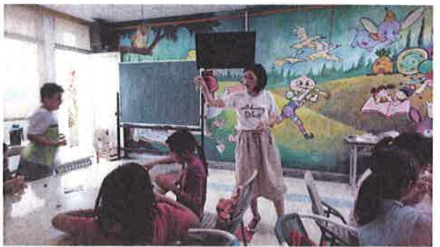
照片說明：結合美勞課程，製作足球吊飾。