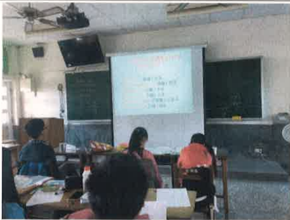
夜市生活英語課程 (1)