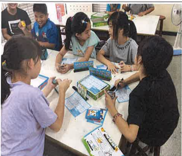
照片說明：樂玩桌遊，遊戲中學習英語