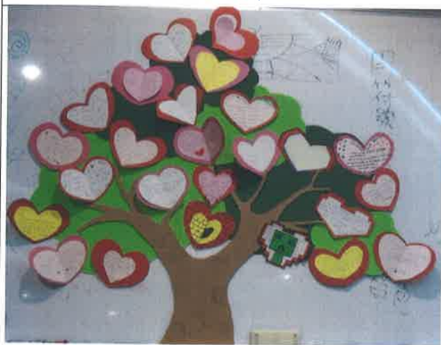
DIY : Blessing Card--Tree of Love 講師：陳蕙君老師