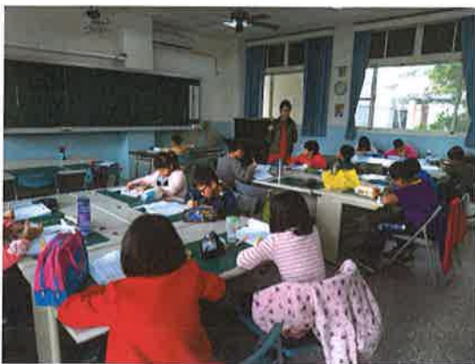
照片說明：教學活動過程