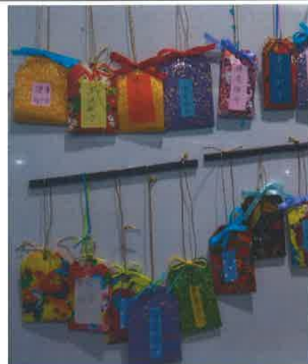
DIY:Blessing Card-健康御守 學生作品