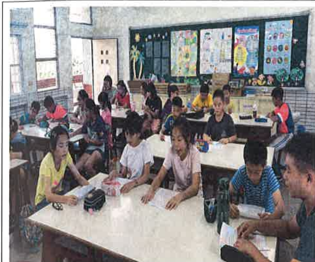
照片說明：英語讀者劇場劇本練習