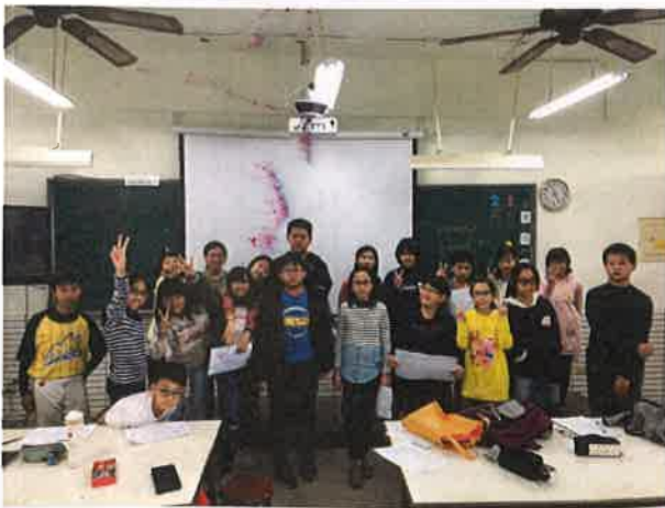
照片說明：學員展演成果