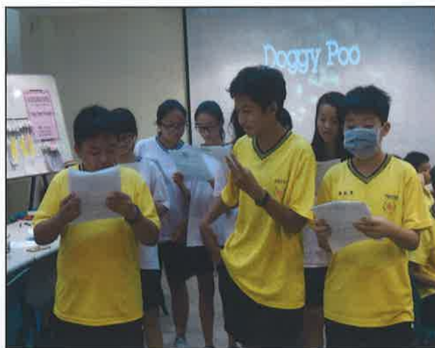
Reader Theater Performance