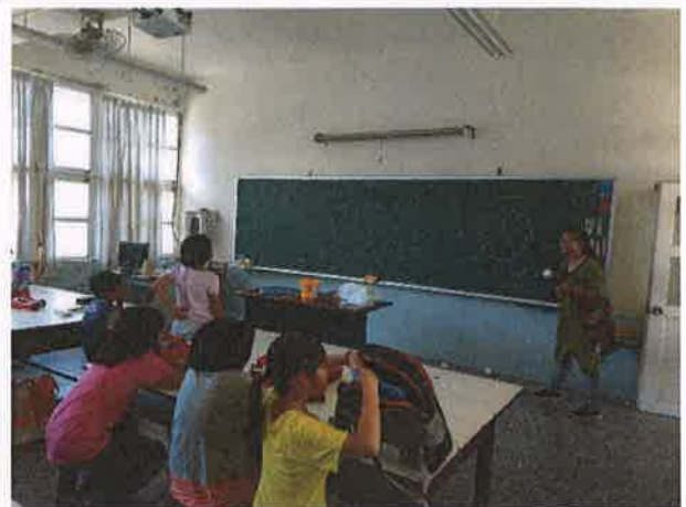
練習用英語回答問題