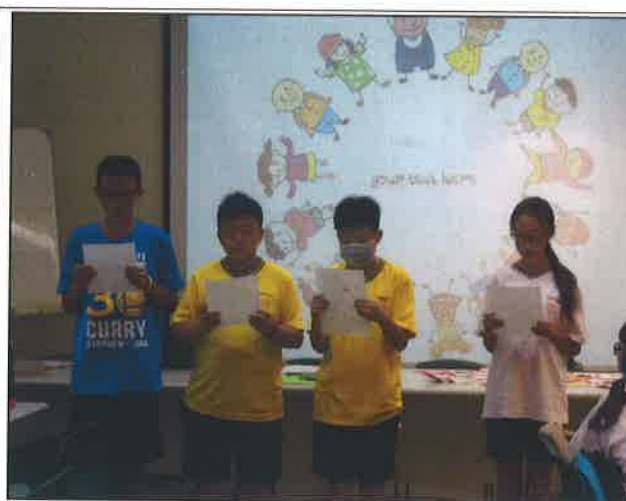
Read Aloud: Universal Love Blessing (祝福地球)