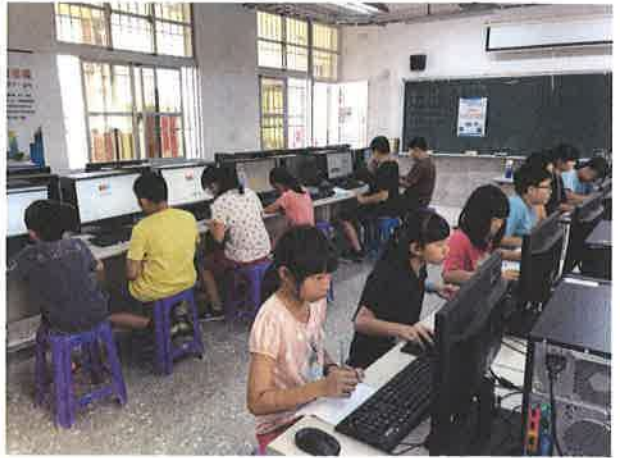
照片說明：利用資訊設備搜尋課程中各國的人口與風土民情。