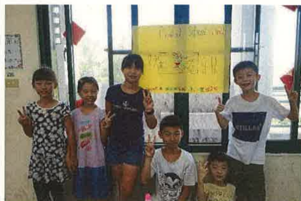
假日英語營學生成果作品(二)