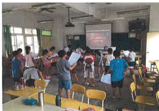
學生練習英語歌唱及舞蹈