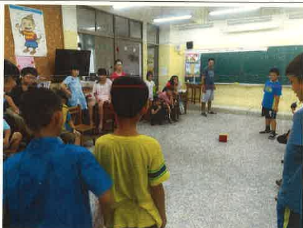
透過英語闖關、歌唱、戲劇、遊戲等，以引發學生英語的學習興趣與成效。