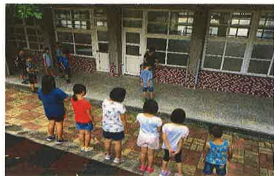
照片說明：從遊戲中，學生學習日常生活對話與完整句子。