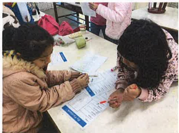
照片說明：分組討論