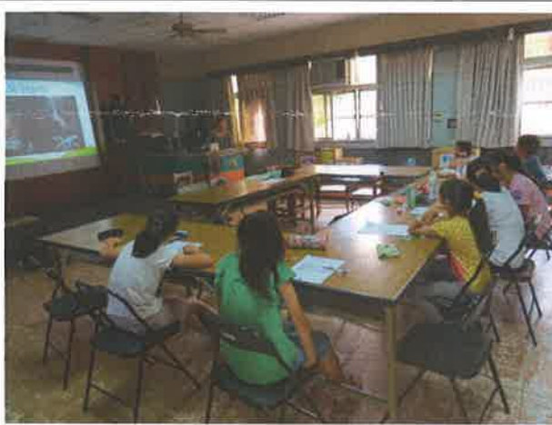
多媒體 E 化教學