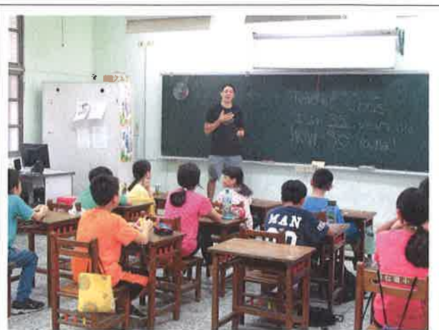
結合中埔教育行動區外師協同上課