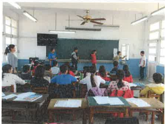
英語比手畫腳教學活動