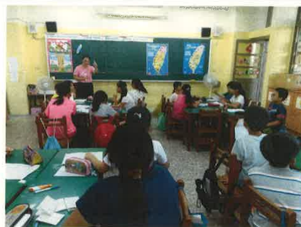
透過英語闖關、歌唱、戲劇、遊戲等，以引發學生英語的學習興趣與成效。