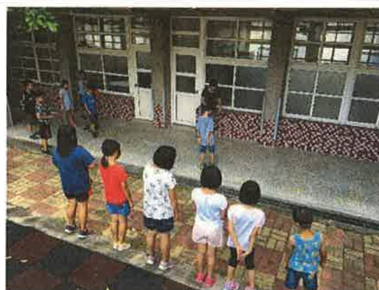
照片說明：跳格子遊戲中，學生學習日常生活對話與完整句子。