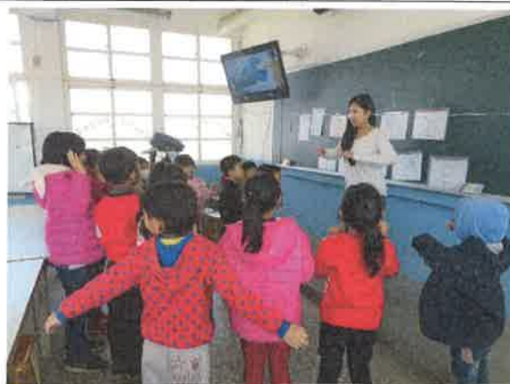
英語唱遊教學活動