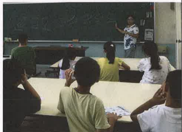
有趣又實用的生活英語