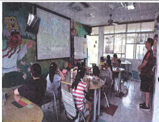
照片說明：和時事結合，介紹激戰中的世足賽。