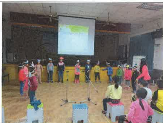
英語成果發表-唱歌跳舞