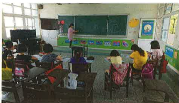
照片說明：自然發音教學，拼音練習。