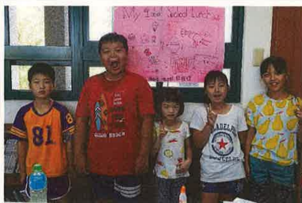
假日英語營學生成果作品(四)