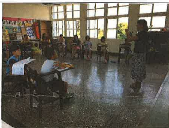
照片說明：自然發音教學，拼音練習。