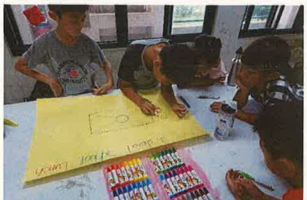
學生認真將英語繪本寫作呈現情形(六)