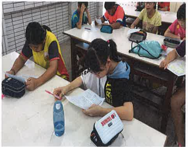
照片說明：英語讀者劇場劇本練習