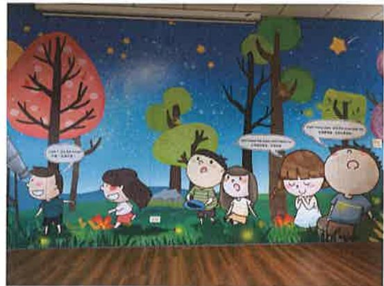
照片說明：英語對話情境布置