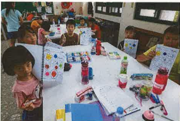
英語繪本寫作成果呈現(三)