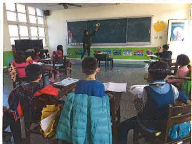
照片說明：棒槌遊戲中，學生學習日常生活對話與完整句子。