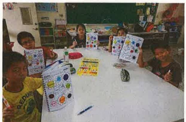
英語繪本寫作成果呈現(四)