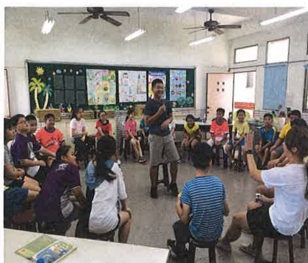
照片說明：Introduce myself 自我介紹