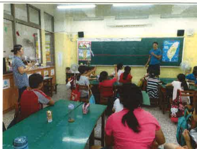
透過英語闖關、歌唱、戲劇、遊戲等，以引發學生英語的學習興趣與成效。