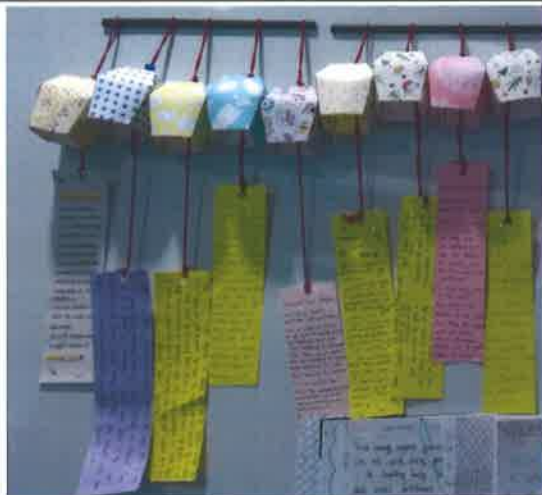
DIY : Blessing Card--Sky Lantern 學生作品