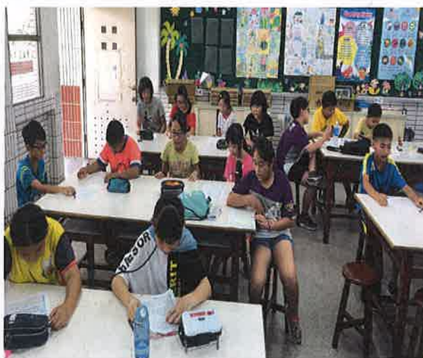
照片說明：劇本共讀