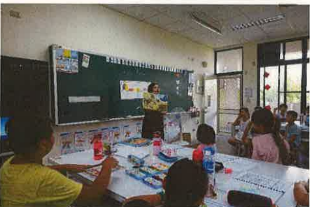
英語教師親自說明學生作品優點(五)